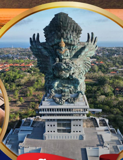
สวนวิษณุ